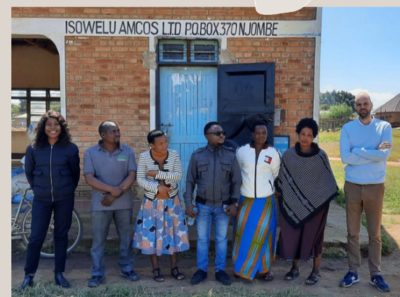
Via het CRAFT-project heeft coöperatie Isowelu in Tanzania hogere opbrengsten en meer leden.

worden coöperaties met marktpotentieel in Kenia, Uganda en Tanzania begeleid bij de ontwikkeling en implementatie van klimaatoplossingen. Coöperatie Isowelu in Tanzania was begonnen met het produceren van aardappels voor de lokale markt. Uit een studie van WUR bleek dat de bodem was verzuurd en dat andere technieken nodig waren. Van Geel vertelt: „Samen met SNV en met HZCP hebben we gewerkt aan zowel het verbeteren van de bodem als aan het verbeteren van de toegang tot pootgoed. Inmiddels zijn hun opbrengsten verhoogd en hebben ze meer leden. Ze doen het als kleine coöperatie erg goed in het zuiden van Tanzania.”