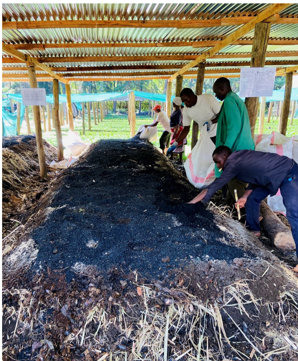
Boeren in Kenia produceren zelf bio-compost.

Het project werd ingehaald door de tijd. Poetin viel Oekraïne binnen en door de opgelegde economische sancties konden de grote exporteurs Rusland en Wit-Rusland geen kunstmest meer leveren. Dit had drastische prijsstijgingen tot gevolg. In Kenia is de prijs van kunstmest sinds de oorlog met 300% gestegen. Ook gewasbeschermingsmiddelen zijn duurder geworden door de hogere prijzen voor brandstof en andere grondstoffen. Daarnaast leidde de exportstopping voor tarwe en graan vanuit Oekraïne –dat