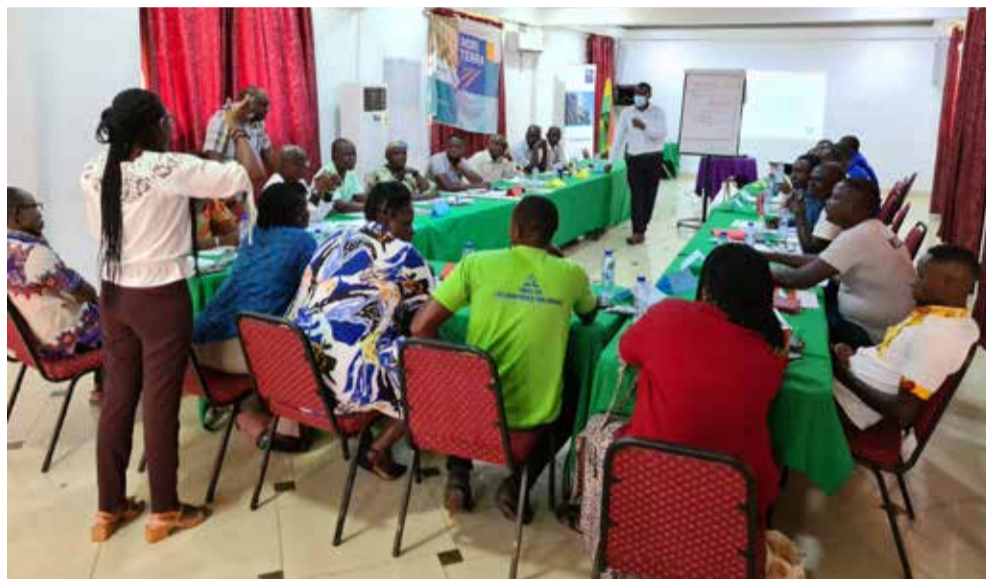
Aan de training deden bestuurders en medewerkers van drie cacao-coöperaties mee.

Door het bespreken en toelichten van deze thema's wordt Goossens zelf zich ook bewuster van de rol die hij heeft als toezichthouder. „Uiteindelijk moeten het bestuur en de toezichthouder ervoor zorgen dat de coöperatie goed loopt, om zo het belang van de leden te dienen.”