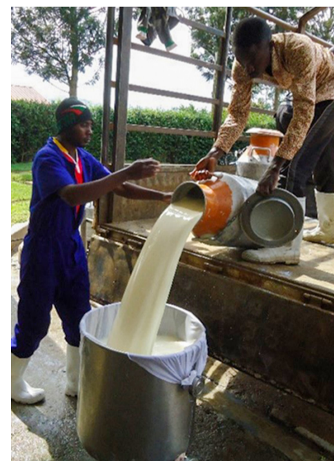
In plaats van plastic jerrycans gebruiken Oegandese boeren nu metalen melkbussen.

Ook is er een vervolgprogramma ontwikkeld, het ISDAP (Integrated Smallholder Dairy Programme). Het doel hiervan is onderzoeken hoe kleine boeren beter opgenomen kunnen worden binnen alle ontwikkelingen in de melkveehouderij. Op dit moment loopt er een pilot om kleine boeren te bereiken in de hooglandregio in Zuid- en Zuidwest-Oeganda.