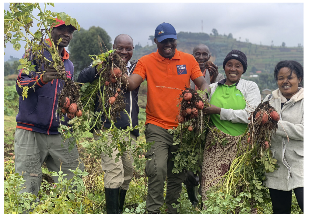
Rwanda heeft een uitstekend klimaat om kwalitatieve pootaardappelen te laten groeien